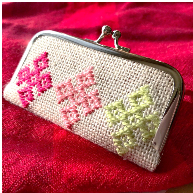
正面には3つ並んだ「花ッコ」の伝統柄。