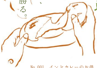
No.001 インドカラーのお供。「チーズクルチャ」